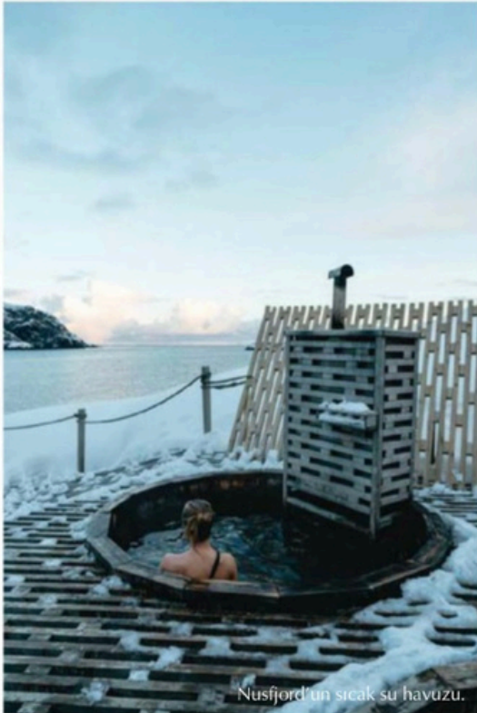
Nusfjord'un sıcak su havuzu.