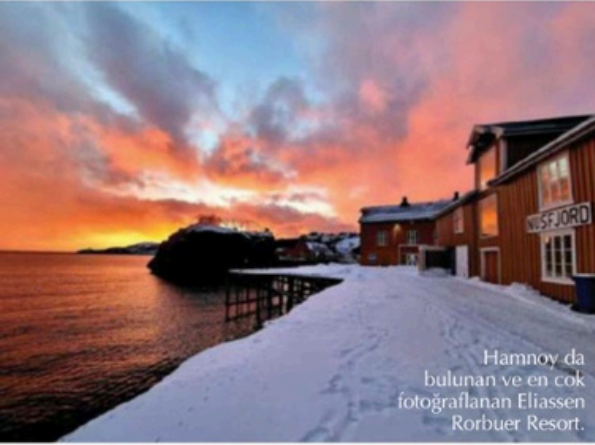
Hamnøy da bulunan ve en çok fotoğraflanan Eliassen Rorbuer Resort.