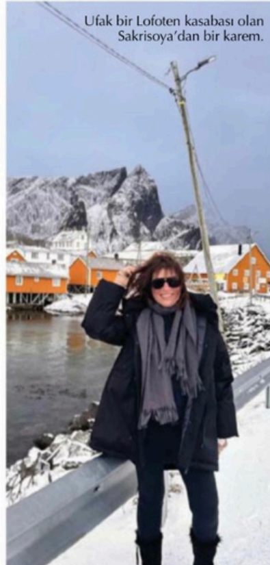
Ufak bir Lofoten kasabası olan Sakrisøya'dan bir karem.

L ofoten Adaları, Norveç Nordland'a bağlı bir takımada ve geleneksel bölge olarak biliniyor. Vestvågøy, Moskenesøya, Gimsøya, Austvågøya ve Flakstadøya'dan oluşan Lofoten Adaları dağları, zirveleri, açık denizi, korunaklı koyları ve plajları ile kendine özgü bir manzaraya sahip. Kuzey Kutup Dairesi'nin hemen üzerinde, 68. kuzey paralelinde yer alan Lofoten, yaz aylarında Geceyarısı Güneşi'nin tadını çıkarırken Eylül'den Nisan'a kadar da büyültü Kuzey Işıkları'na tanıklık ediyor.