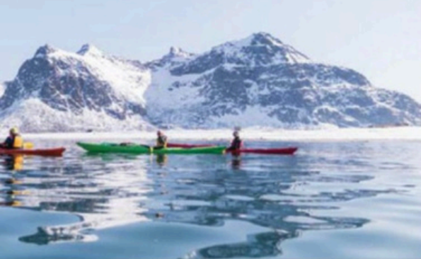
Bölgedeki outdoor aktivitelerinden biri de kayaking.