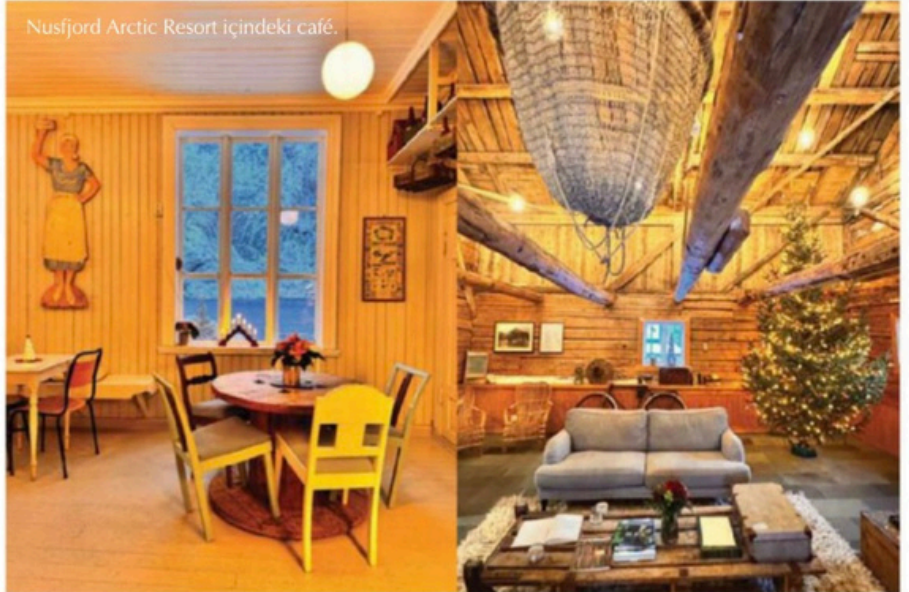
Nusfjord Arctic Resort içindeki café.

manzarası ile Hamnøy Bridge (en ünlü Lofoten manzarası için) ve en ünlü köyü Rein. Köprülerle birbirine bağlanan birkaç küçük adadan oluşan Reine, Norveç'te rorbu adı verilen balıkçı kulübeleri ile ünlü. Rorbu, normalde balıkçı köylerinde bulunan ve balıkçılar tarafından kullanılan, Norveç'te geleneksel bir mevsimlik ev türü. Ancak şimdilerde daha çok turistleri ağırlamak üzere kullanılıyor. Binalar yapısal olarak karada dururken bir ucu gemilere kolay ulaşım sağlaması için direklerle suyun içinde bulunuyor. Adaların en güney noktası ise A köyü. Tüm adaları birbirine bağlayan E10 otoyolundan kuzeye ve güneye giderek dağlarla denizen birleştiği fiyortlarda eşsiz manzaralar izlemek mümkün. Hava iyiyse kayak, bot turları veya rehber eşliğinde dağlara tırmanış yapabileceğiniz en doğru aktiviteler. Biraz daha şehir hayatını sevenler içinse kuzeyde bulunan Henningvaer şehrini öneririm.