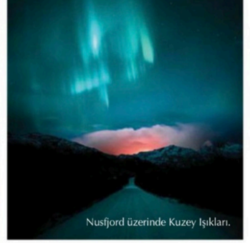
Nusfjord üzerinde Kuzey Işıkları.