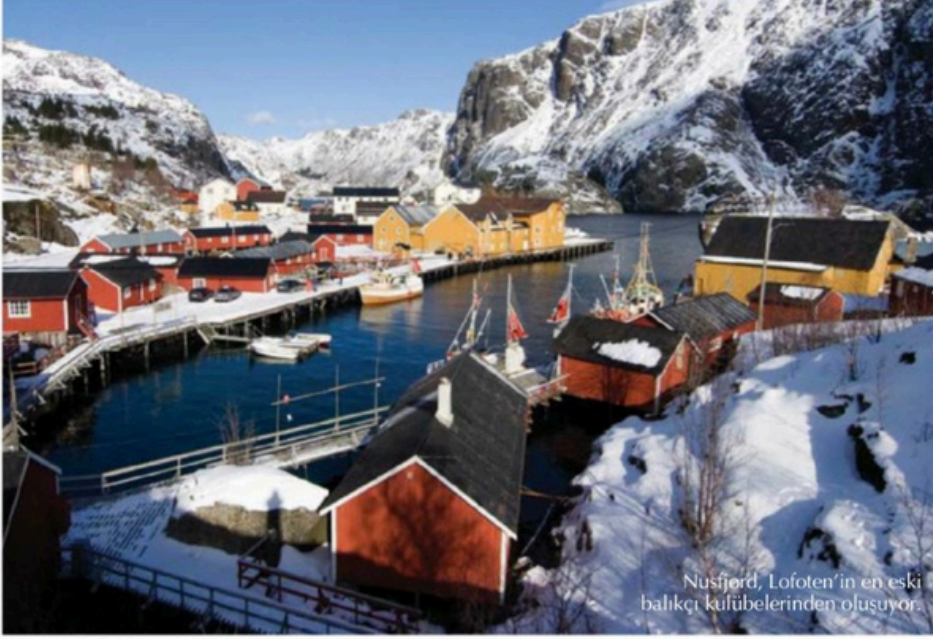
Nusfjord, Lofoten'in en eski balıkçı kulübelerinden oluşuyor.