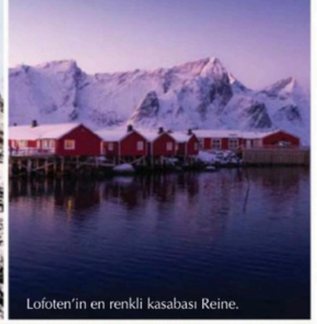
Lofoten'in en renkli kasabası Reine.