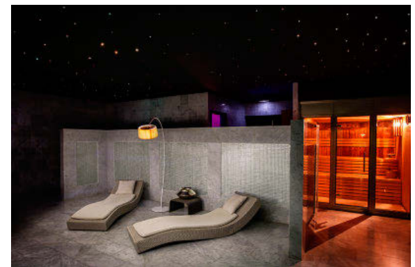
WELLNESS. Consta de jacuzzi, ducha de contraste, hammam, sauna, fuente de hielo y zona de relax.

televisores de Loewe. Seis de las estancias son suites, entre las que destaca la llamada El Torreón, ubicada en la cúpula del edificio, con 85 m 2 , terraza, cristalerías y una bañera de mármol del siglo XIX.