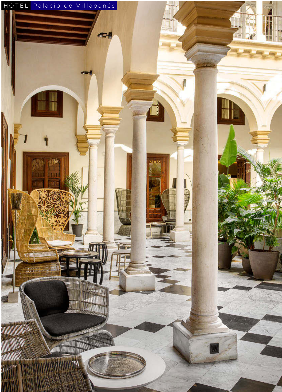
PATIO. Mantiene la estructura original de cuando se construyó el palacio a principios del siglo XVIII.