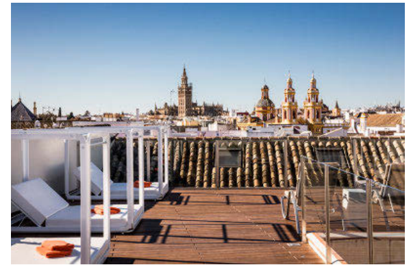
AZOTEA. Con vistas a la Giralda, cuenta con alberca, zona de solárium con hamacas y camas balinesas.