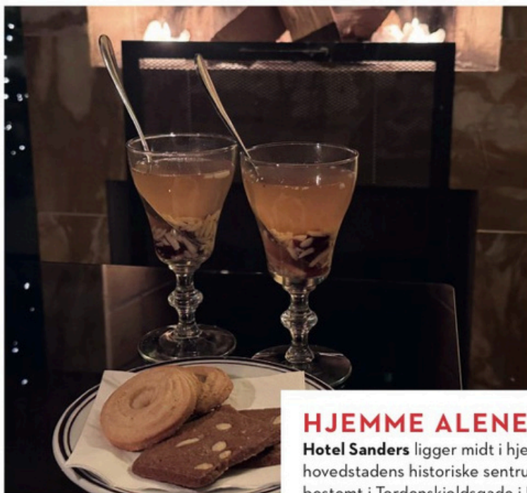
Eplegløgg og hjemmebakete julekaker ved peisen på Hotel Sanders.