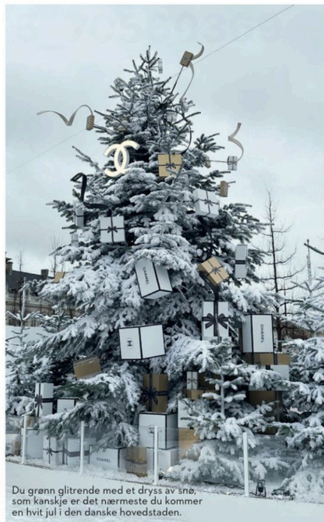
Du grønn glitrende med et dryss av snø, som kanskje er det nærmeste du kommer en hvit jul i den danske hovedstaden.

I år, for første gang på 16 år, er den berømte skøytebanen på Kongens Nytorv tilbake. Den har vært borte på grunn av byggingen av Københavns metro, men i år kan man igjen gå på skøyter rundt Krinsen – en juletradisjon for mange københavnere. Og Refshaleøen blir til Skøjteøen med to skøytebaner på 1450 kvadratmeter, lysinstallasjoner, konserter, markeder, utstillinger, mat og drikke. Du finner også skøytebaner mange andre steder i byen. Og selv om det kanskje ikke blir helt som på film, er det unektelig noe stemningsfullt og julete med å snøre på seg skøytene, om ikke annet for en litt halvveis piruett ute på isen med tilhørende varm sjokolade eller dansk eplegløgg etterpå.