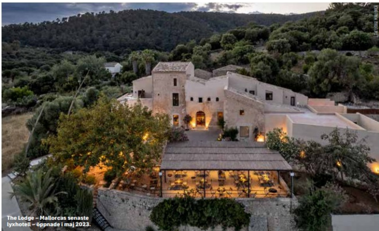
The Lodge – Mallorcas senaste lyxhotell – öppnade i maj 2023.