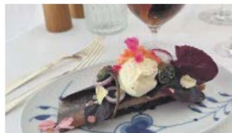
EN SMAK AV DANMARK: Slik kan en av smørrebrødene hos Møntegade se ut.