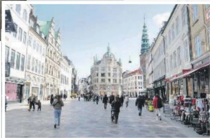
PÅ STRØGET: Europas lengste gågate er shoppinggata med både dyre og billige butikker.