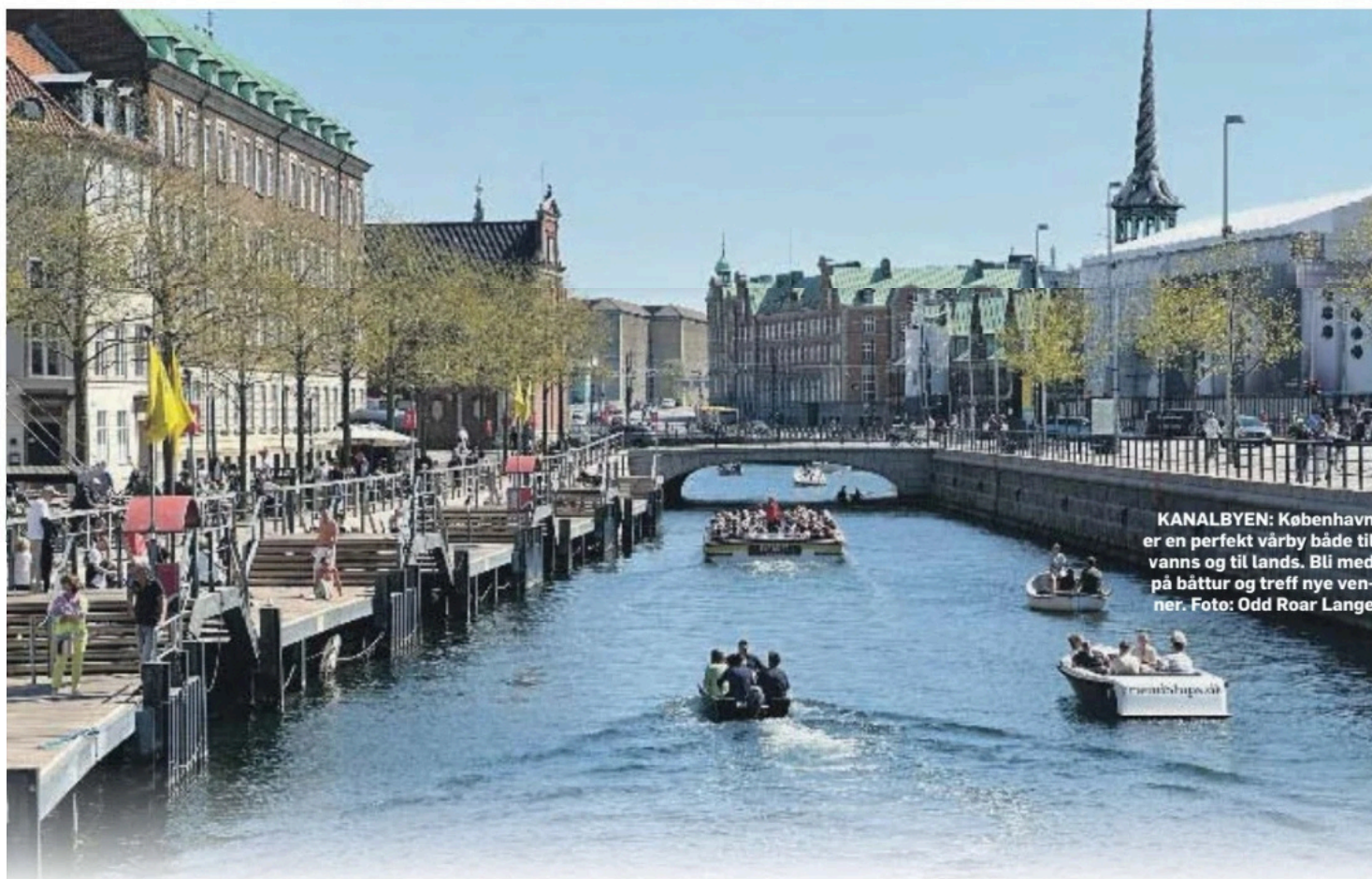
KANALBYEN: København er en perfekt vårby både til vanns og til lands. Bli med på båtture og treff nye venner.

→ niske betongtyren modellert av Einar Utzon-Frank over døra, ligger Kødbyens Fiskebar.